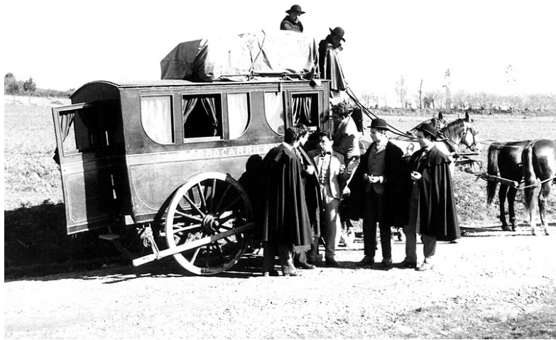
Imagen de un carruaje que hacía el recorrido A Coruña-Santiago a principios del pasado siglo

La edición tiene el acierto de ponernos de nuevo ante unos textos que lejos de ajarse con los años mantienen la tersura y aportan nuevos matices a la luz de nuestros días. No es de desdeñar el eco escondido en las palabras que se van arrinconando o que creíamos abandonadas o empujadas al olvido por otras nuevas y sin pasado. De las páginas de Viajes por España emerge la fragancia de una prosa